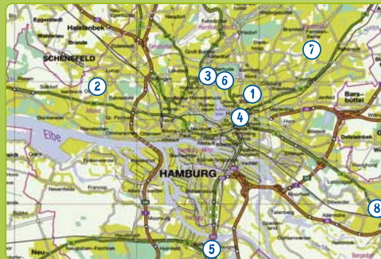
Karte © FHH – Landesbetrieb Geoinformation und Vermessung