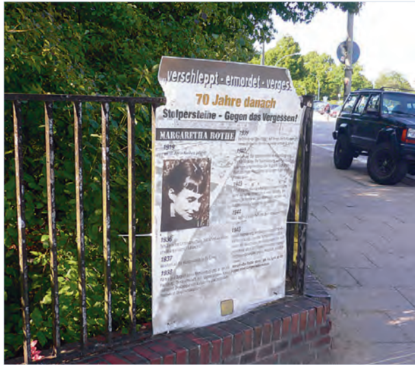
Stolpersteinplakate in St. Georg „Gegen das Vergessen“.