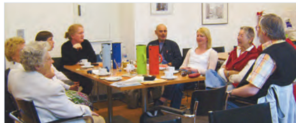
Seit 1999: Erzählcafés des St. Pauli-Archivs.