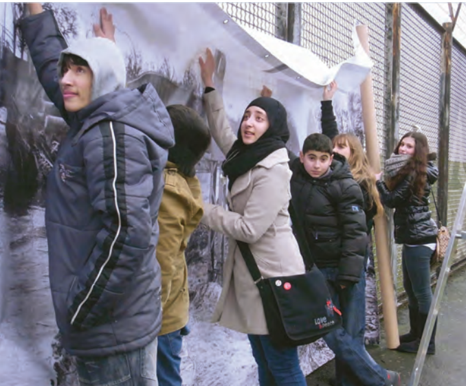
Schüler des Sturmflut-Workshops beim Aufhängen eines Großplakates.