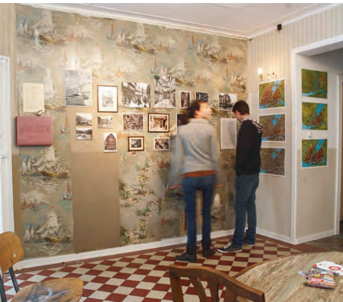
Ausstellung im Gängeviertel.