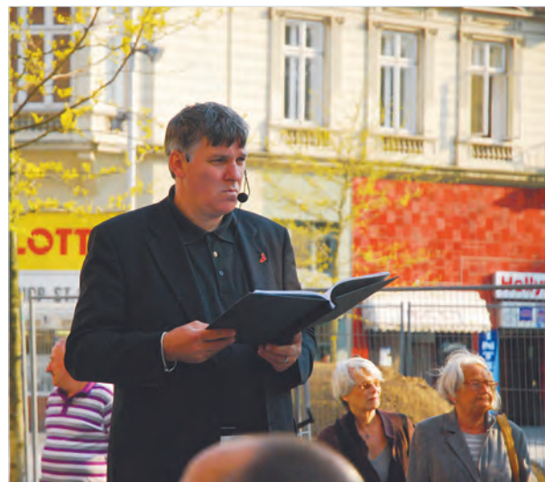
Szenische Lesung der GW St. Georg zum Stolpersteinprojekt auf dem Hansaplatz.