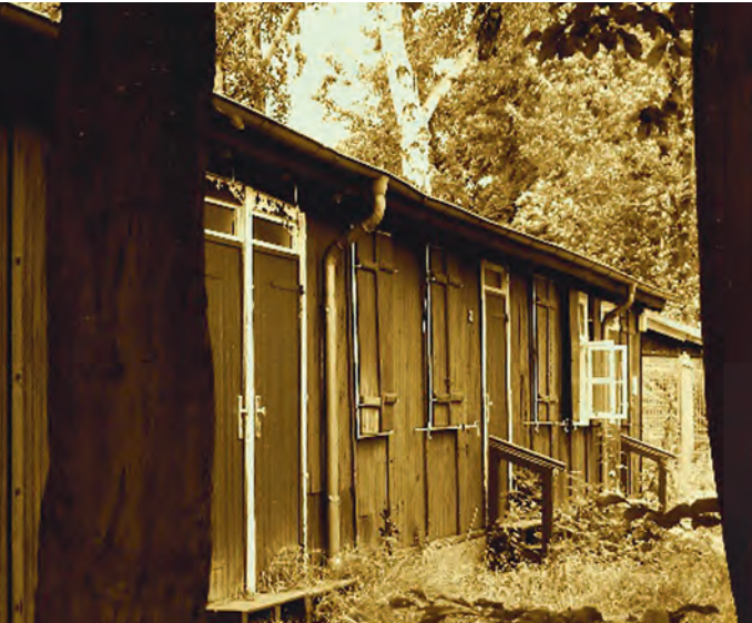
Ehemalige Zwangsarbeiterbaracke in Fuhlsbüttel.