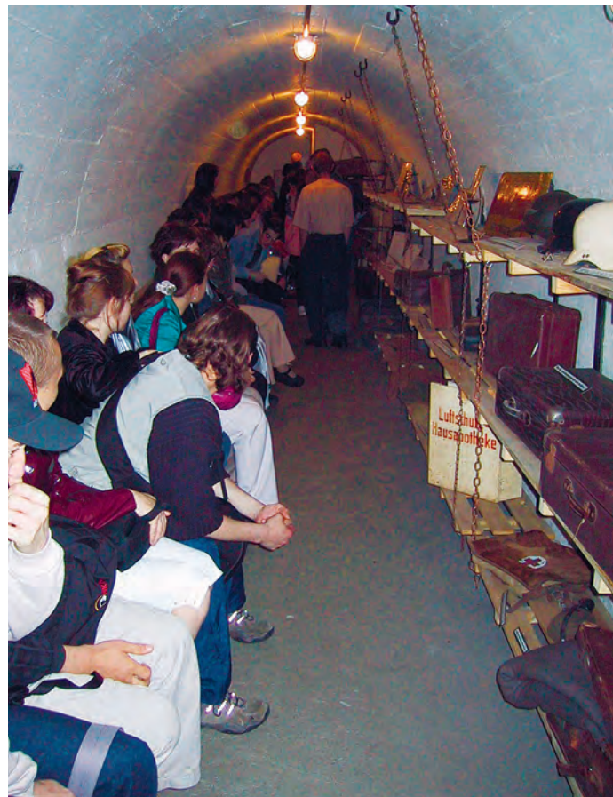
Das Bunkermuseum Hamburg in Hamm.

E-Mail: stadtteilarchiv@hh-hamm.de http://hh-hamm.de