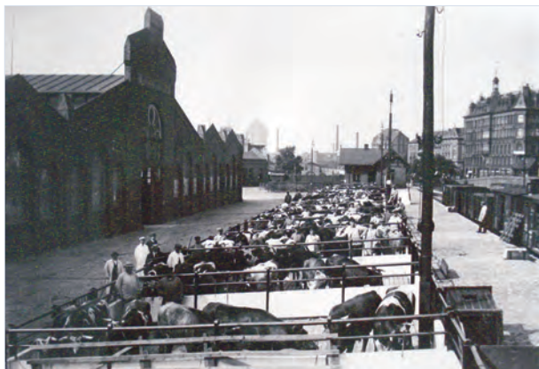
Viehmarkt an der alten Rindermarkthalle, 1924 auf dem HGF.