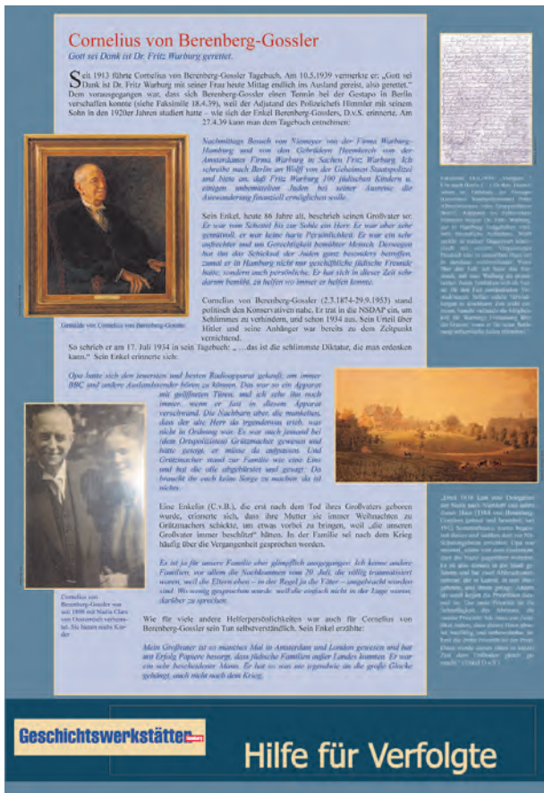
Eine Tafel der Ausstellung „Hilfe für Verfolgte in Hamburg 1933 - 1945“.