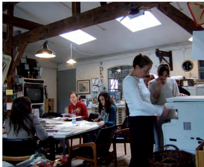
Schüler/-innen bei der Archivrecherche im Stadtteilarchiv Ottensen.

Brigitte Abramowski, Telefon: 040 / 390 36 66 oder E-Mail: info@stadtteilarchiv-ottensen.de