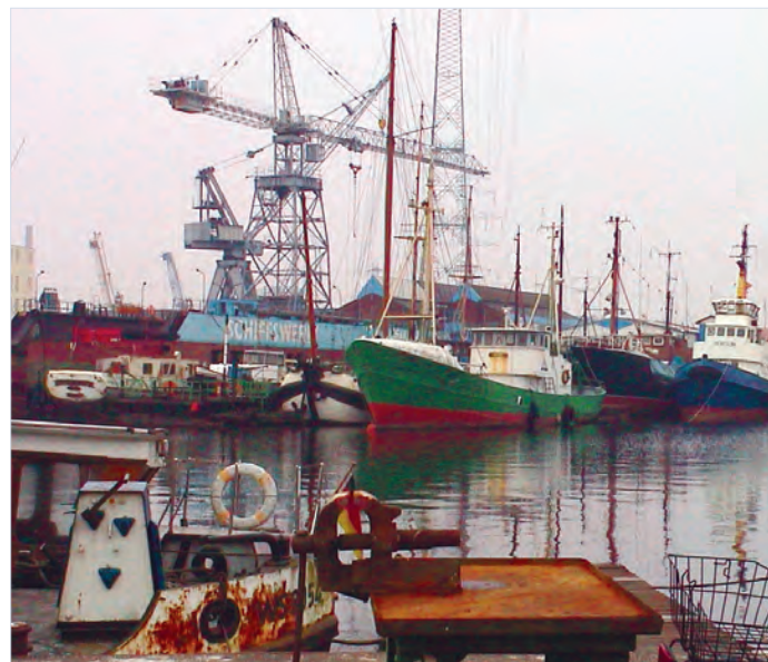
Der Harburger Binnenhafen.