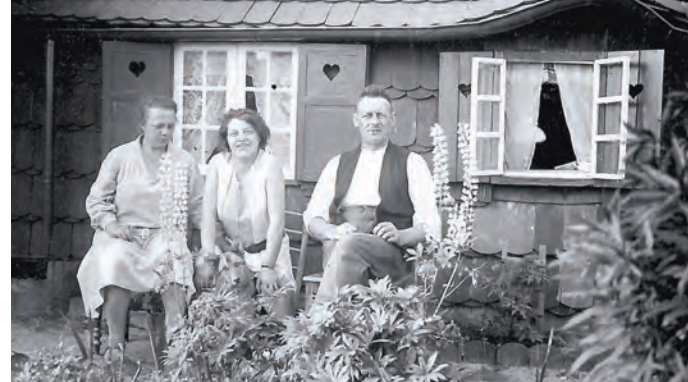
Viele Siedlungen am Schiffbeker Weg waren anfangs Laubenkolonien.

Kontakt: Ralph Ziegenbalg, info@geschichtswerkstatt-billstedt.de