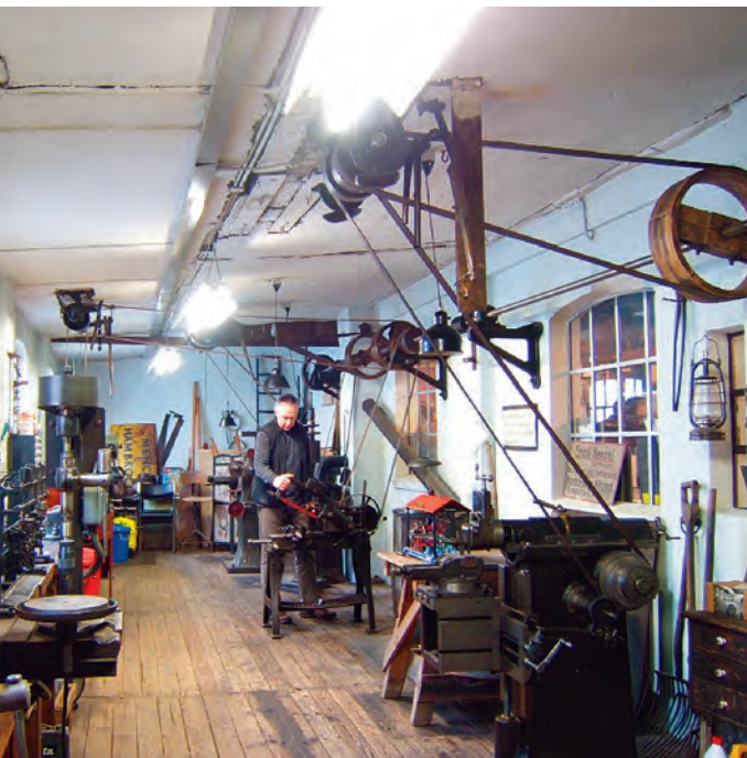
Schlosserei der ehemaligen Drahtstifte-Fabrik.

Seit 1980 kooperiert das Stadtteilarchiv Ottensen mit Altonaer und anderen Hamburger Schulen. Ziel ist es nicht nur, die heimatische Umgebung und ihre Geschichte zu erkunden und erforschen, sondern auch, dass Jugendliche benachbarter oder entfernter Bezirke und Stadtteile aus ihrem „Kiez“ herauskommen und einen anderen Stadtteil in seiner spezifischen Struktur kennenlernen.