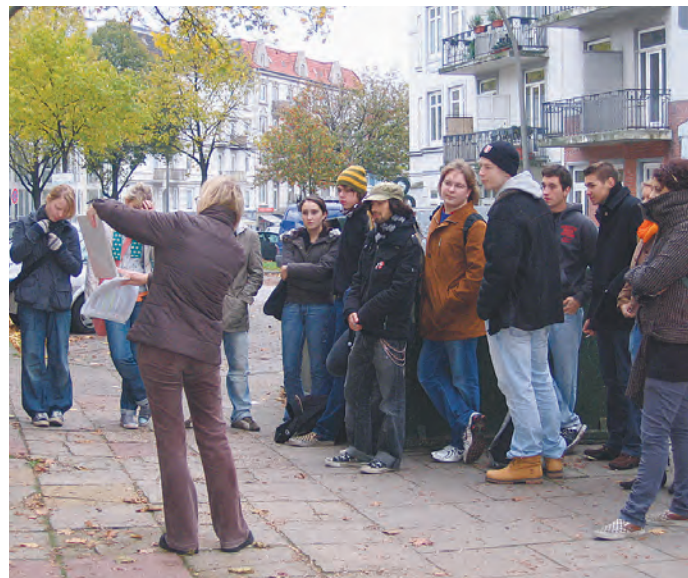
Geschichtsrundgang des Stadtteilarchivs für Schüler, 2010.