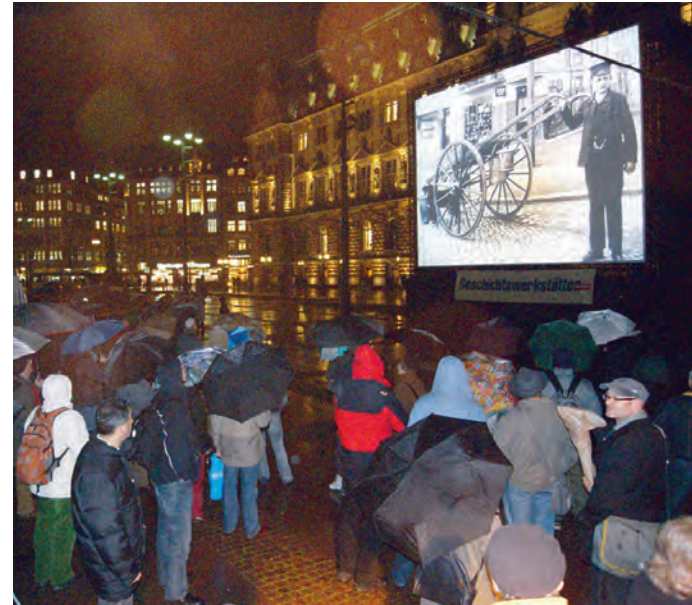
Das Geschichtsspektakel „Augenblicke“ auf dem Rathausmarkt, 2009.

Dem 2010 erschienenen gleichlautenden Buch soll ein zweiter Band folgen, der weitere neue Helfergeschichten dokumentiert und eine