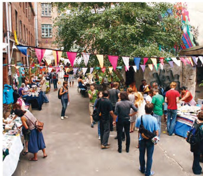
Fest im Gängeviertel.