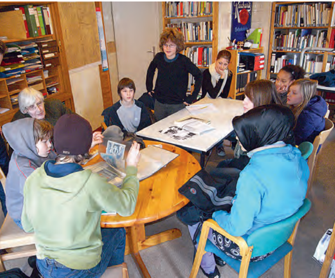
Schülerarbeit in der Geschichtswerkstatt Barmbek.

Geschichts Heimat Werkstatt Museum Barmbek