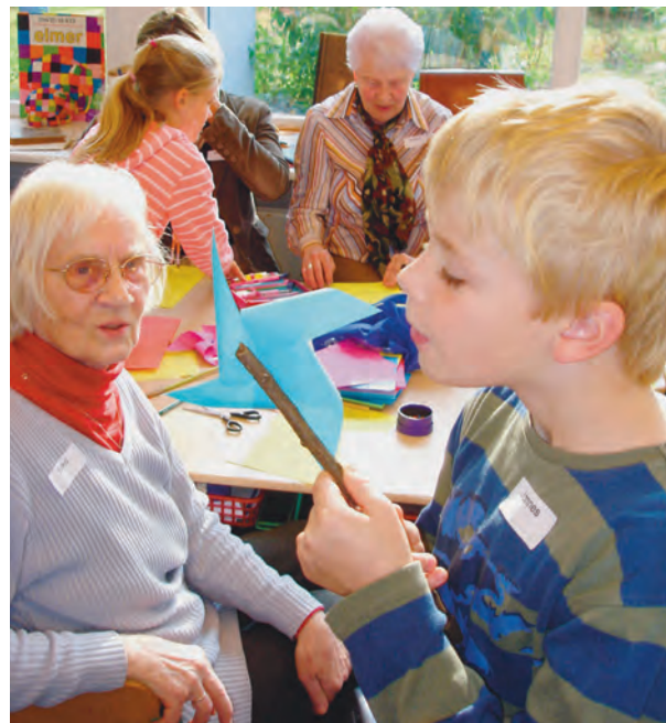
Historisches Kinderprojekt in Bramfeld.