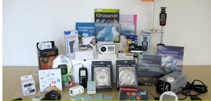
Klimakiste Sek I

Schulen erhalten kostenlos eine Klimakiste Grundschule, wenn mindestens zwei Lehrkräfte an einer Fortbildung teilgenommen haben.