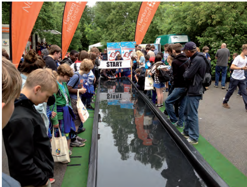
ZSU-Messe 2013 „ZERO-Emission Wettbewerb“

Adresse: Hemmingstedter Weg 142, 22609 Hamburg