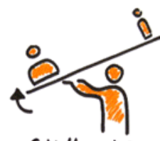
Schief lagen ins Gleichgewicht