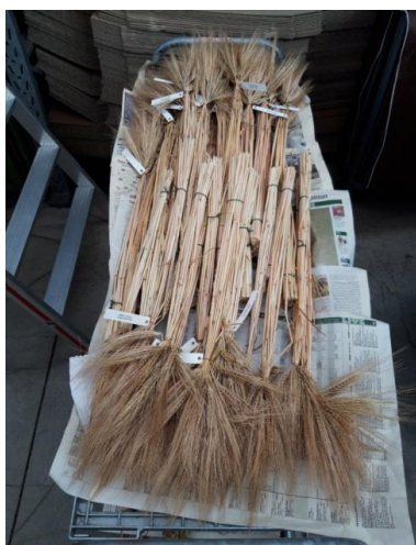
Getreide (Art. 44) Gerste