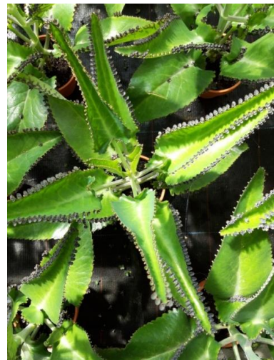
Brutblatt (Art. 13,1) Versuchspflanze