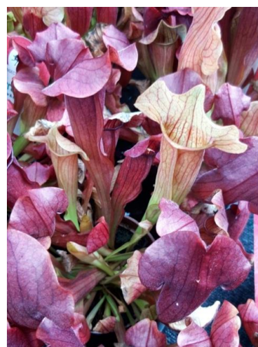
Schlauchpflanze (Art. 17,1) Insektivoren III