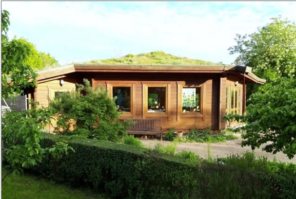
Das Grüne Klassenzimmer im Loki-Schmidt-Garten

Homepage LI: https://li.hamburg.de/ausserschulische-lernorte/gruene-schule