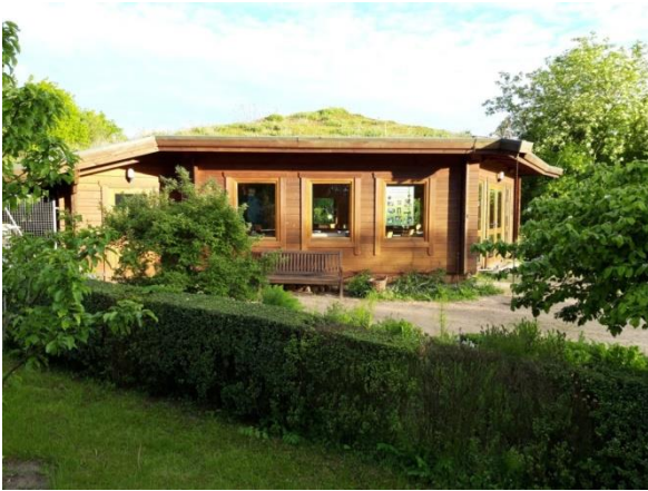
Pavillon der Grünen Schule